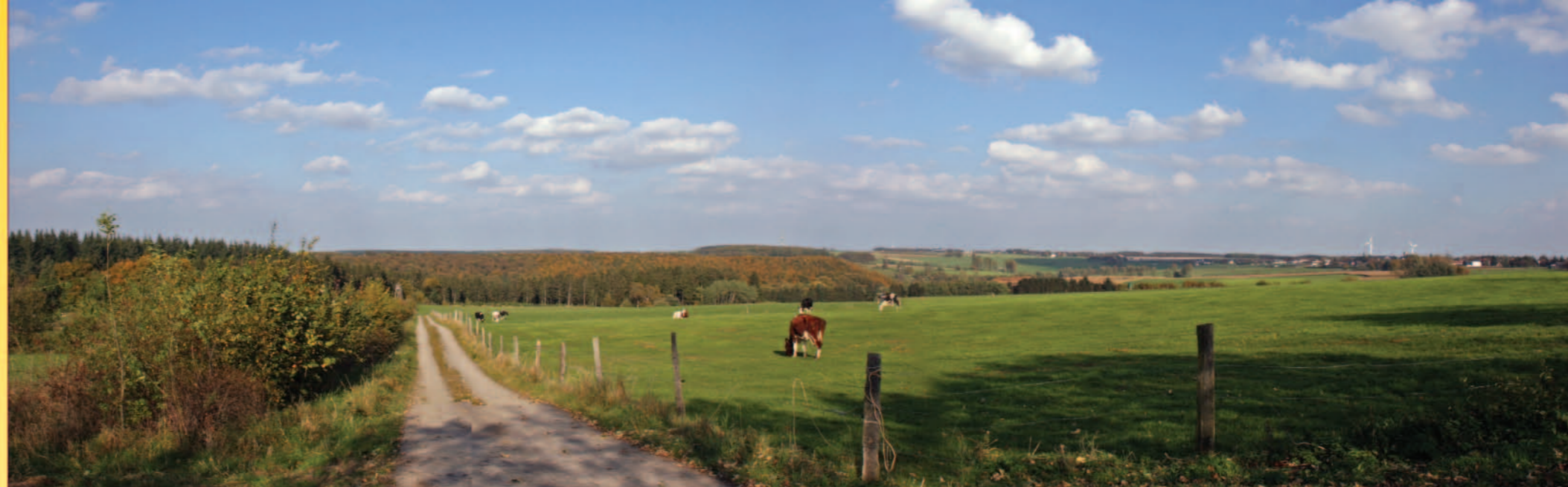
Landschaftspanorama am „Brandenburger Tor“