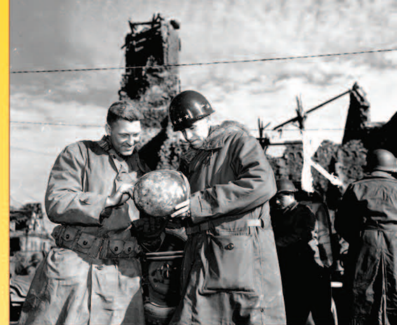
Generalleutnant Omar N. Bradley in Hürtgen, 19. Februar 1945

„Bevor er sich zur Ruhe begeben konnte, fragten wir ihn frei heraus, was denn dran wäre an den Gerüchten über den Hürtgenwald. 'Es ist die Hölle!' murmelte er tonlos, 'die reine, unverfälschte Hölle – das ist das einzige Wort dafür: Hölle!' Ein wildes Funkeln schien aus seinen Augen zu kommen: 'Ihr habt davon nichts gehört, weil sie Angst haben, mit euch darüber zu reden. Ganz einfach Angst, darüber zu reden. Die Deutschen haben unsere Division in Stücke gerissen, einfach zerfetzt. Und sie haben auch aus anderen Einheiten die Scheiße rausgeprügelt. Ich bin bei der Division, seitdem wir in Frankreich gelandet sind, aber so was habe