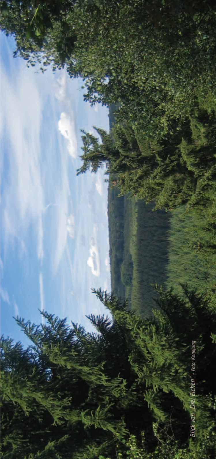
Blick von „Drei Eichen“

unter großen Opfern am 6. und 7. Dezember 1944 durch das 2. Ranger-Bataillon gestürmt. Doch erst lange nach der deutschen Gegenoffensive in den Ardennen, am 1. März 1945, gelang es der Ersten US-Armee, die dem „Hill 400“ gegenüberliegende Stadt Nideggen einzunehmen.