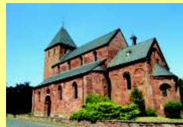
St. Johannes Baptist