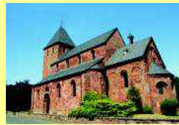
St. Johannes Baptist