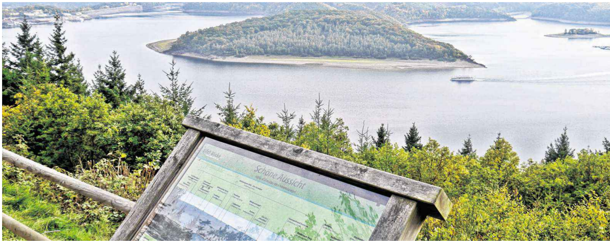
Der Blick von der „Schönen Aussicht“ auf Rursee und Kermeter: Dem Wanderer bieten sich imposante Ausblicke.